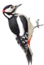
Grote bonte specht